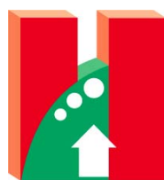
香港房屋經理學會 The Hong Kong Institute of Housing