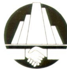
香港地產行政學會 Hong Kong Institute of Real Estate Administration