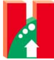
香港房屋經理學會 The Hong Kong Institute of Housing