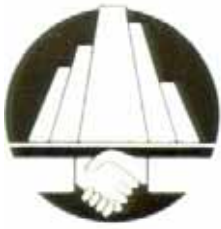
香港地產行政師學會 Hong Kong Institute of Real Estate Administrators